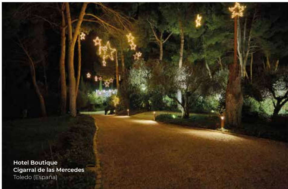
Hotel Boutique Cigarral de las Mercedes Toledo (España)