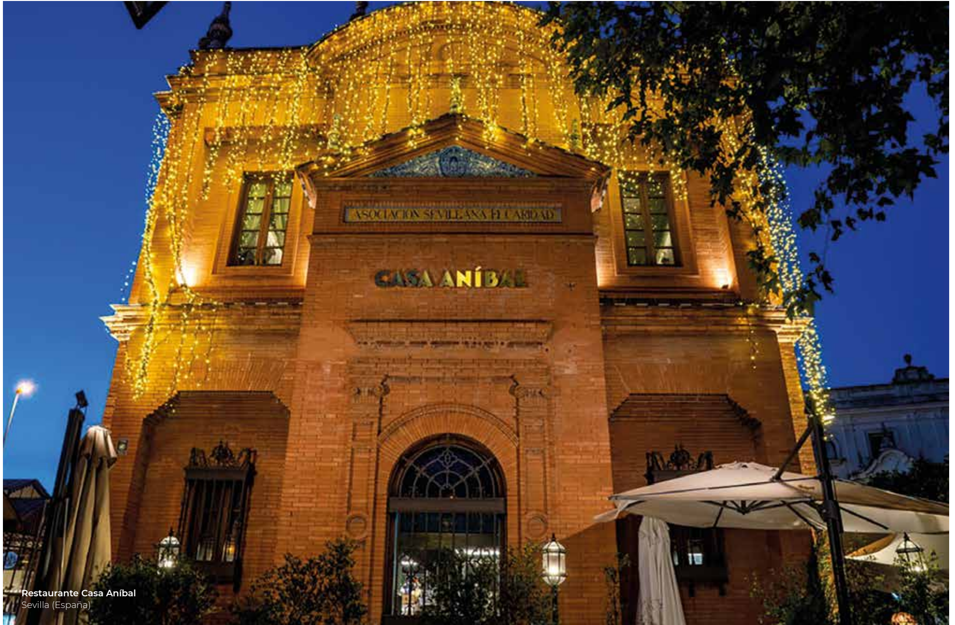
Restaurante Casa Aníbal Sevilla (España)