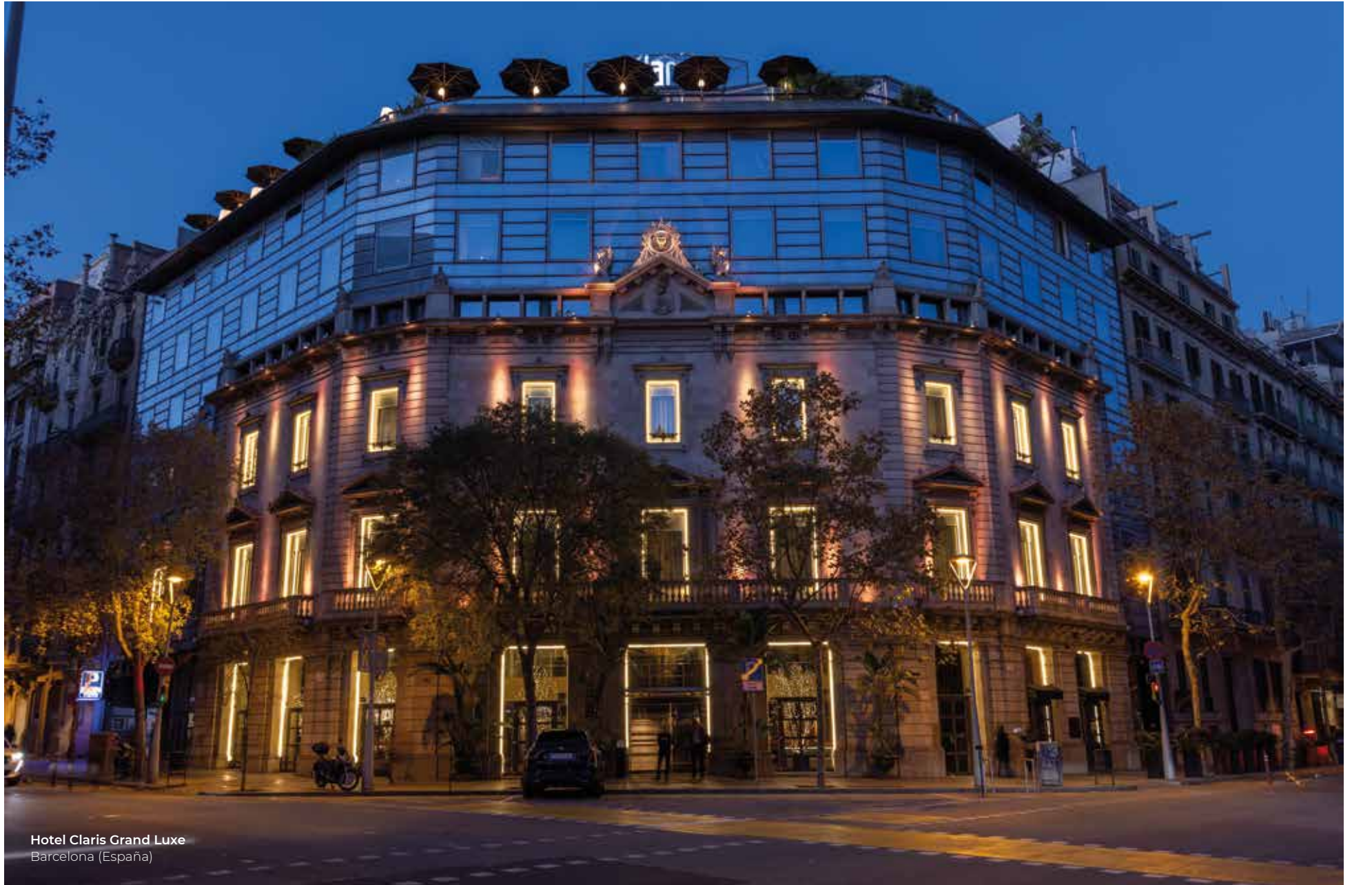
Hotel Claris Grand Luxe Barcelona (España)