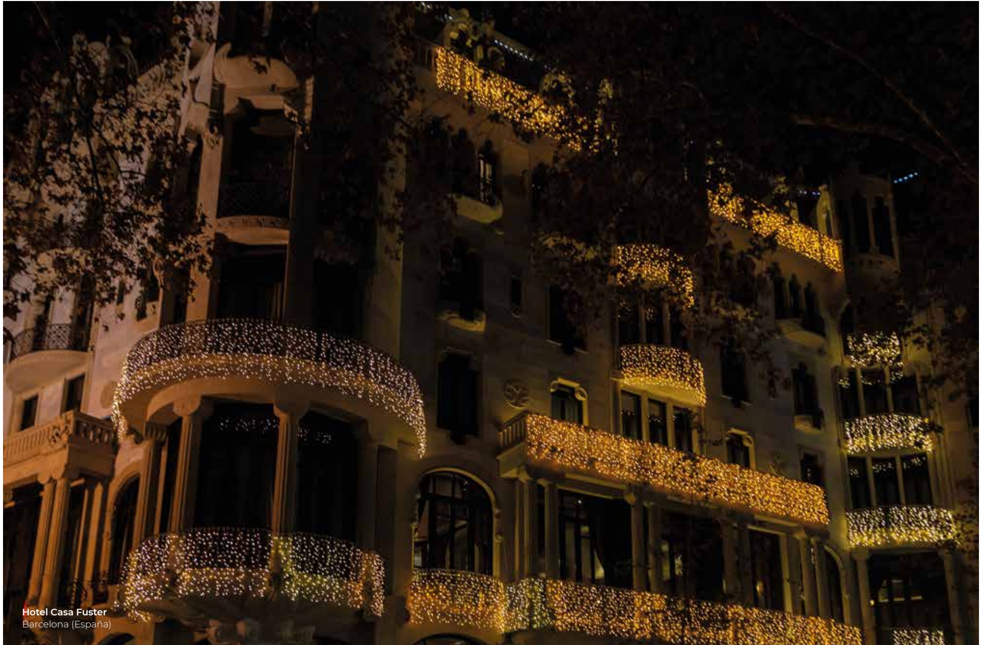
Hotel Casa Fuster Barcelona (España)