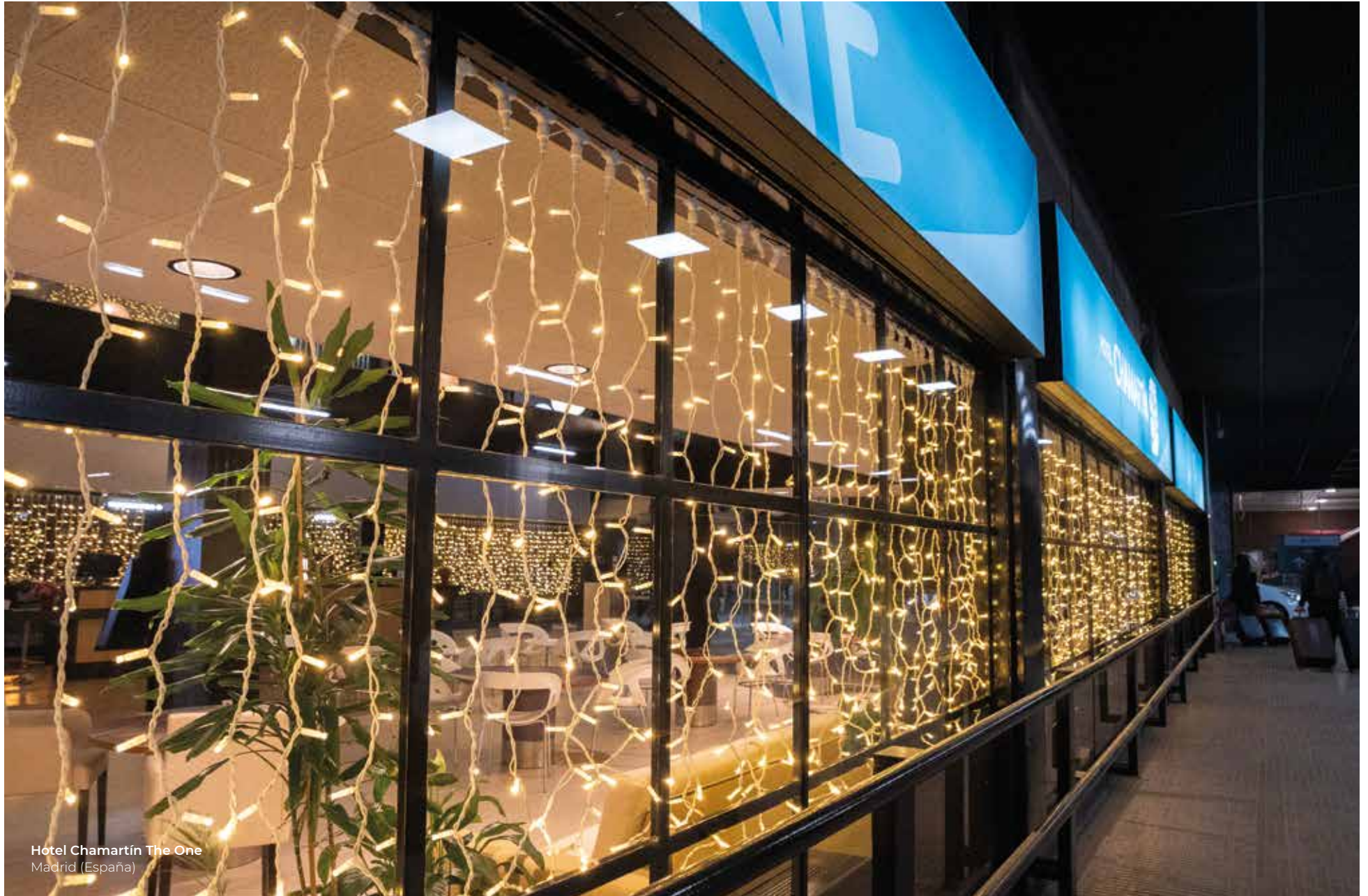
Hotel Chamartín The One Madrid (España)