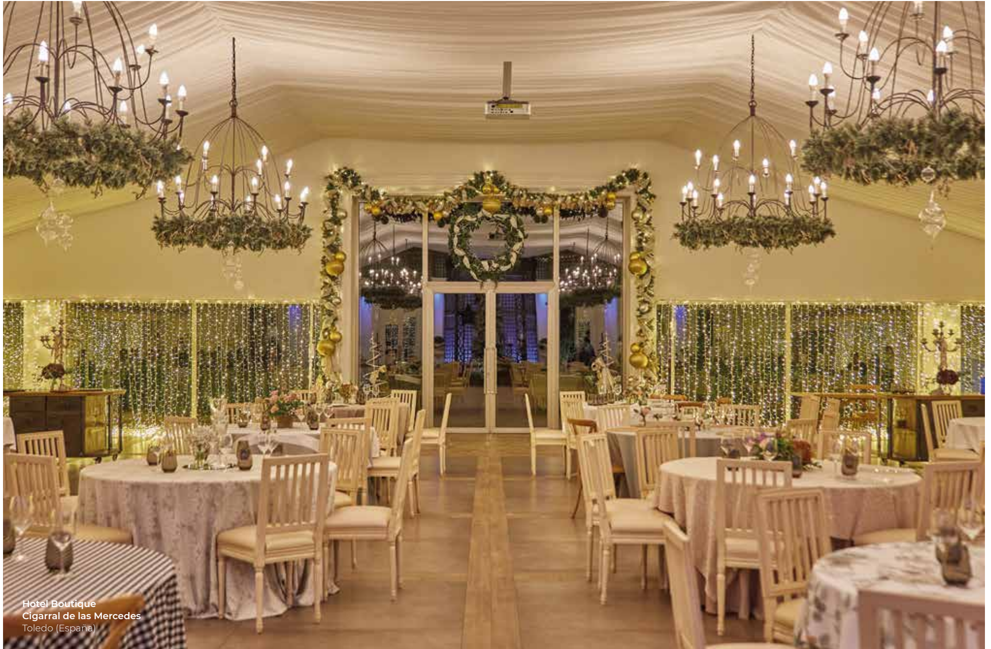
Hotel Boutique Cigarral de las Mercedes Toledo (España)