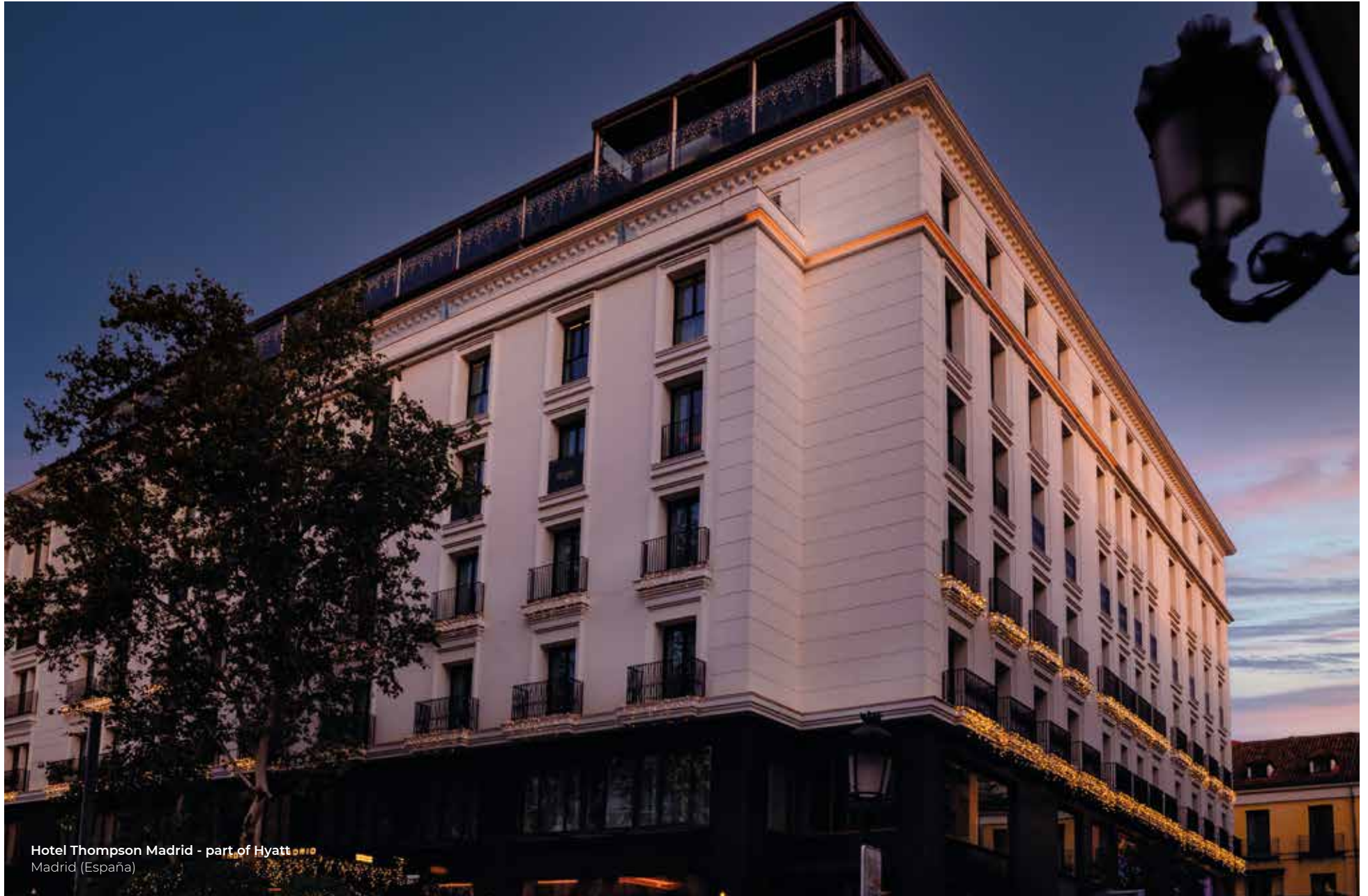
Hotel Thompson Madrid - part of Hyatt Madrid (España)