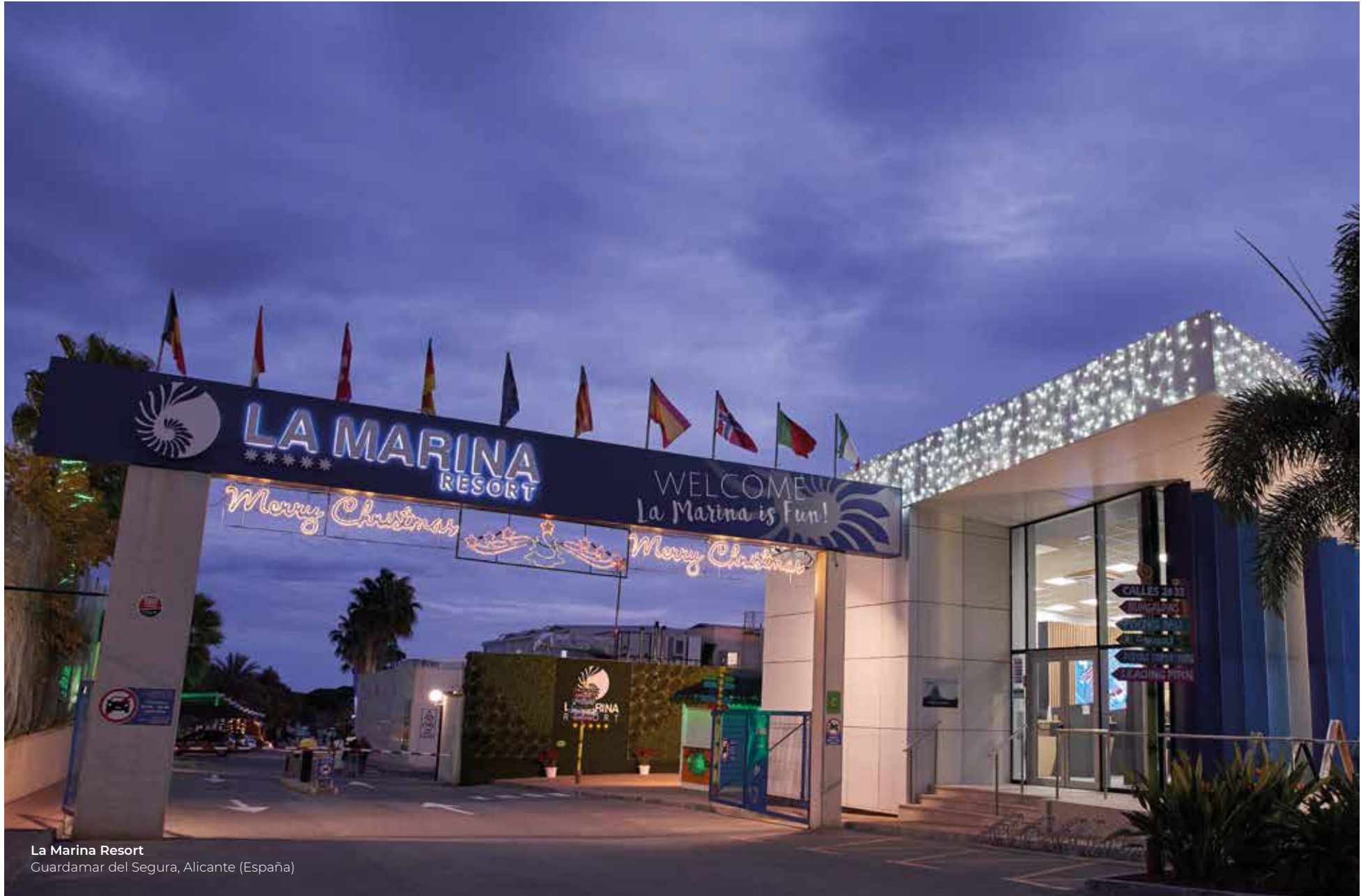
La Marina Resort Guardamar del Segura, Alicante (España)