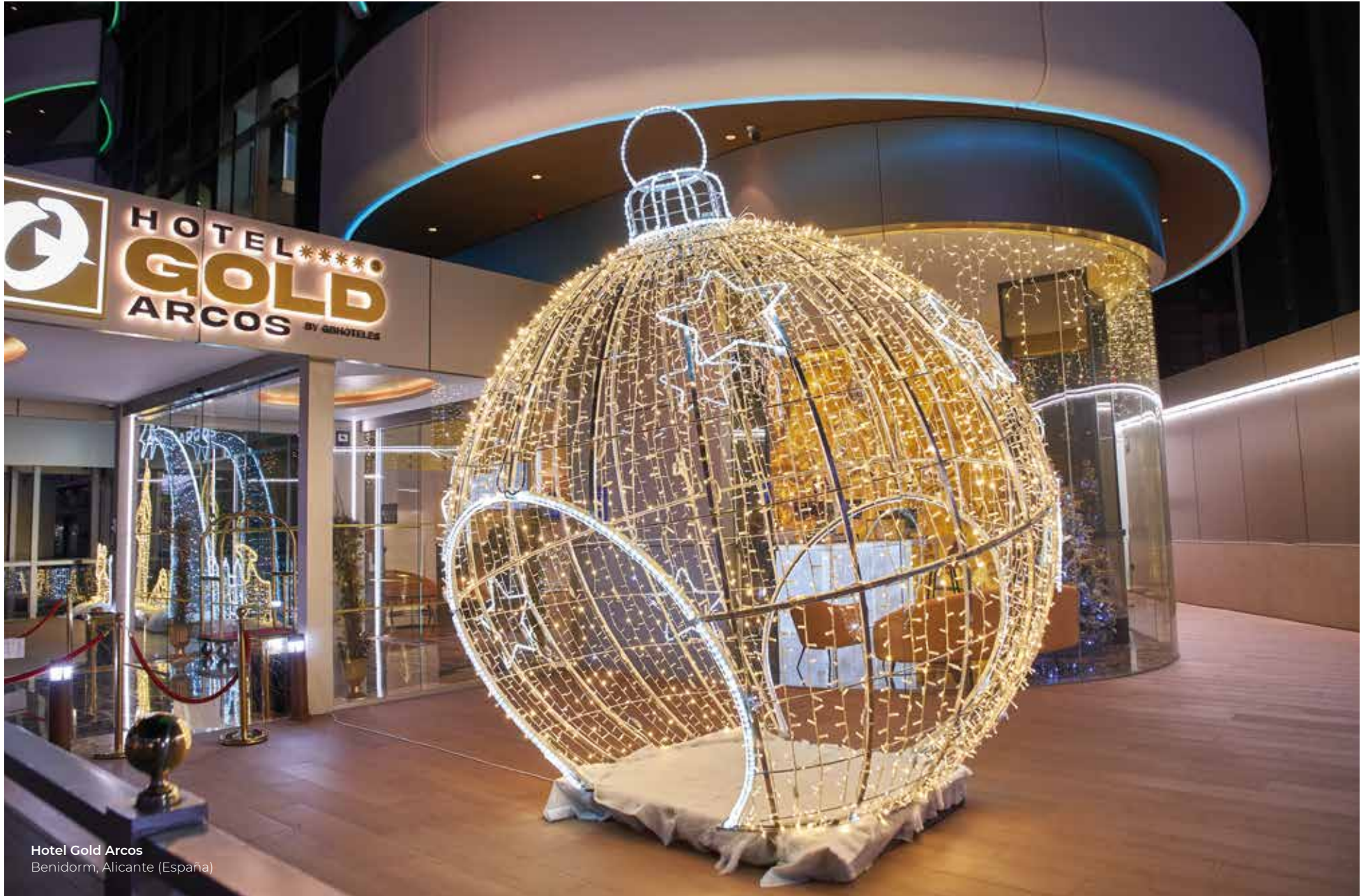
Hotel Gold Arcos Benidorm, Alicante (España)