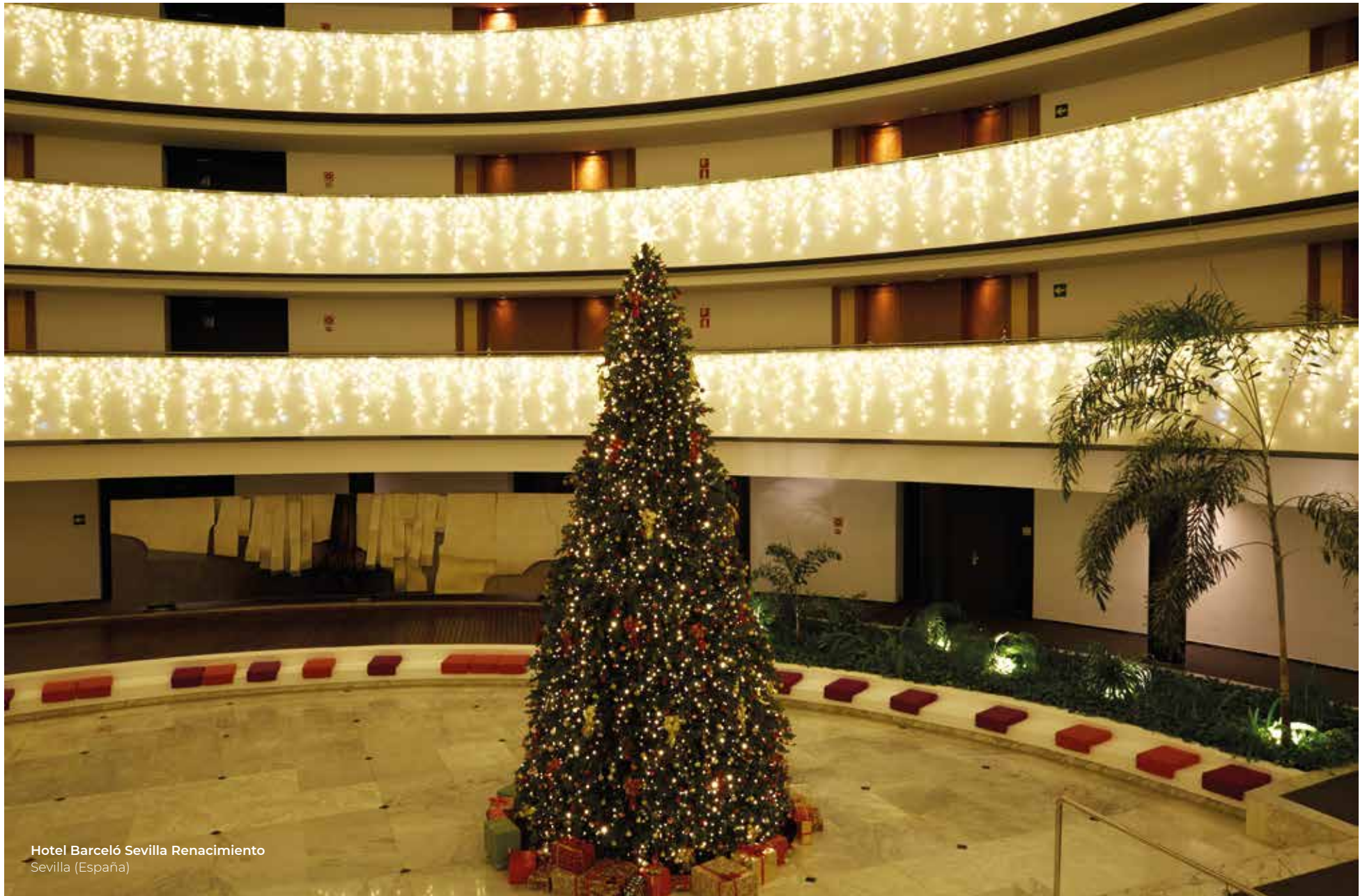
Hotel Barceló Sevilla Renacimiento Sevilla (España)