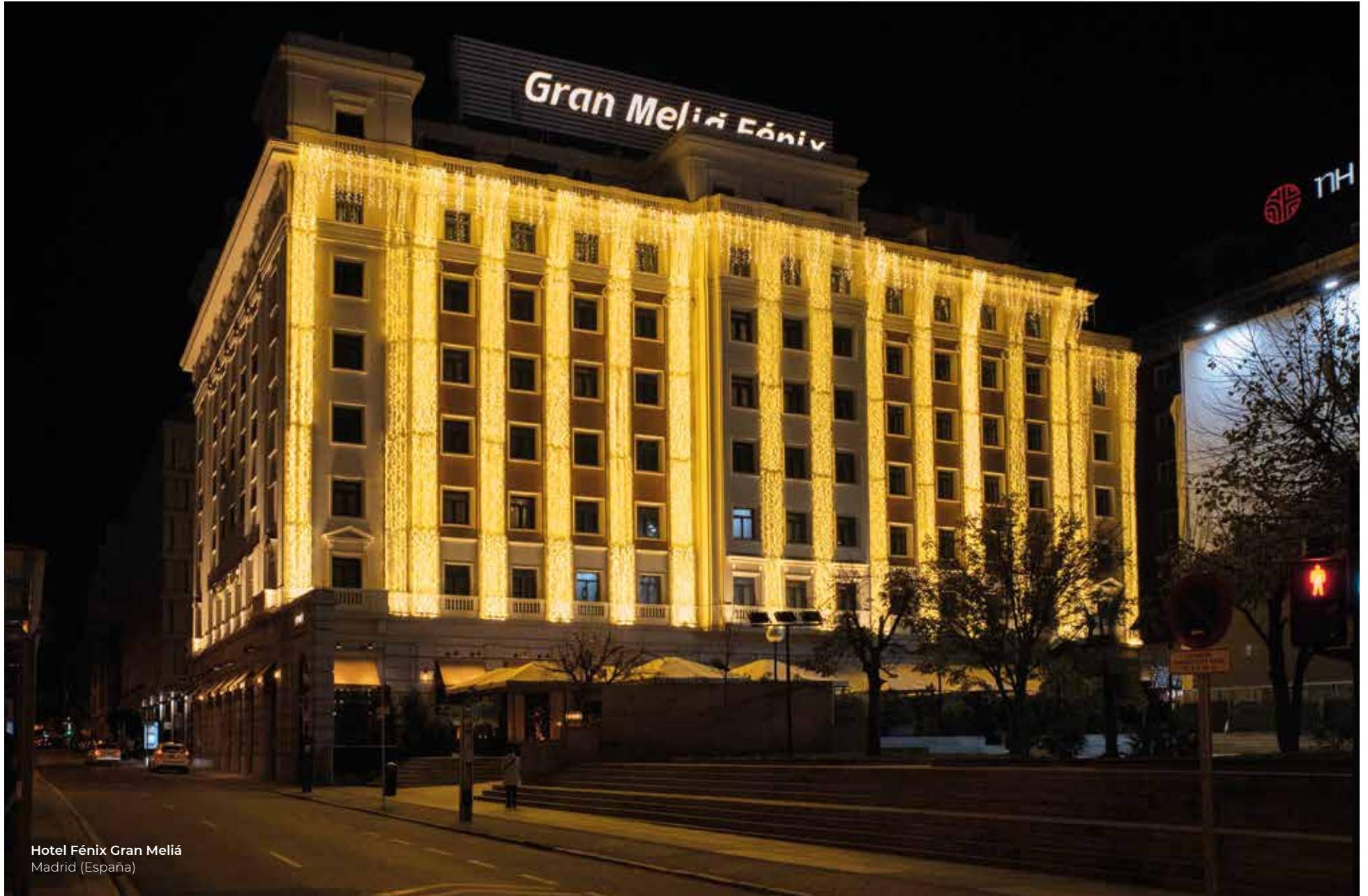
Hotel Fénix Gran Meliá Madrid (España)