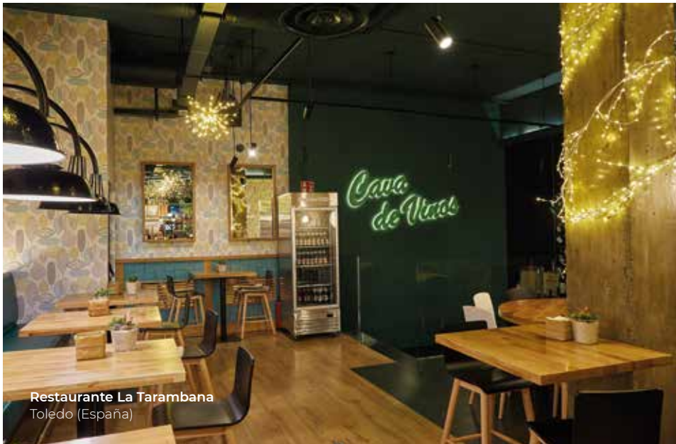
Restaurante La Tarambana Toledo (España)