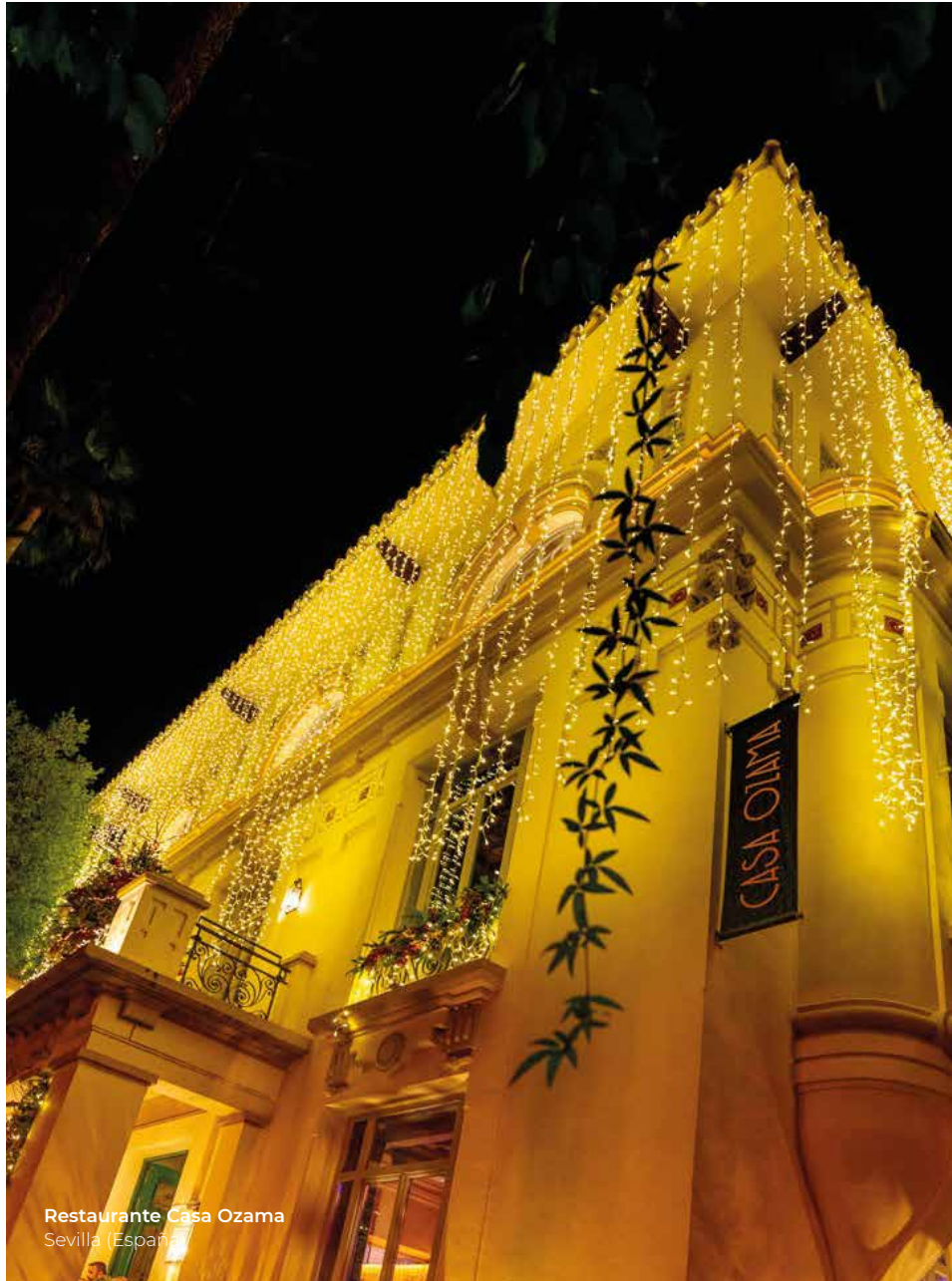
Restaurante Casa Ozama Sevilla (España)