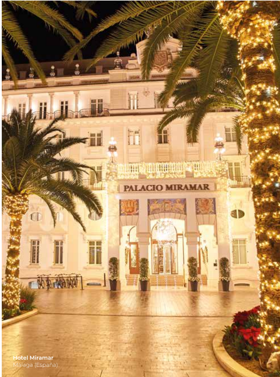
Hotel Miramar Málaga (España)