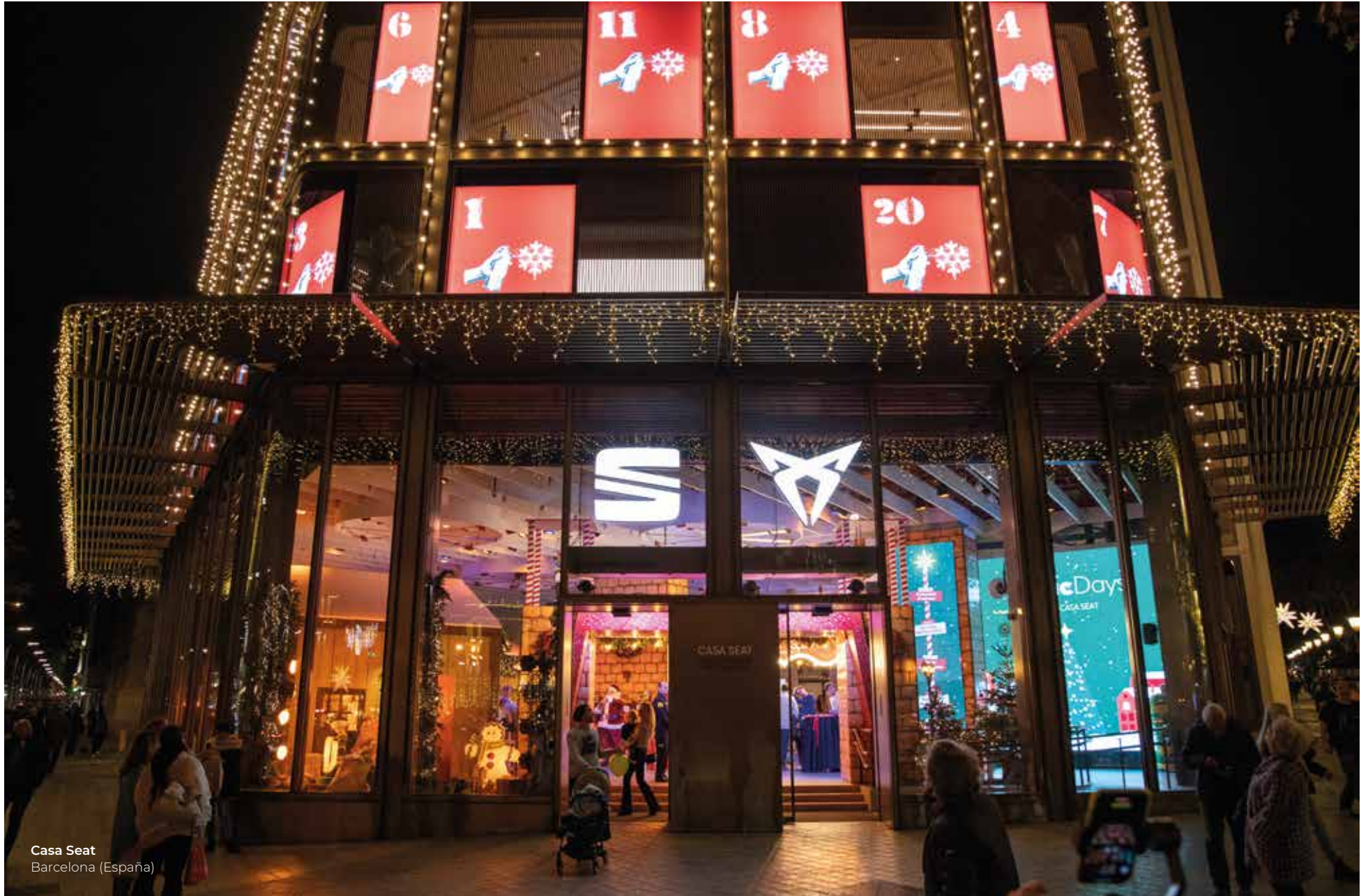
Casa Seat Barcelona (España)