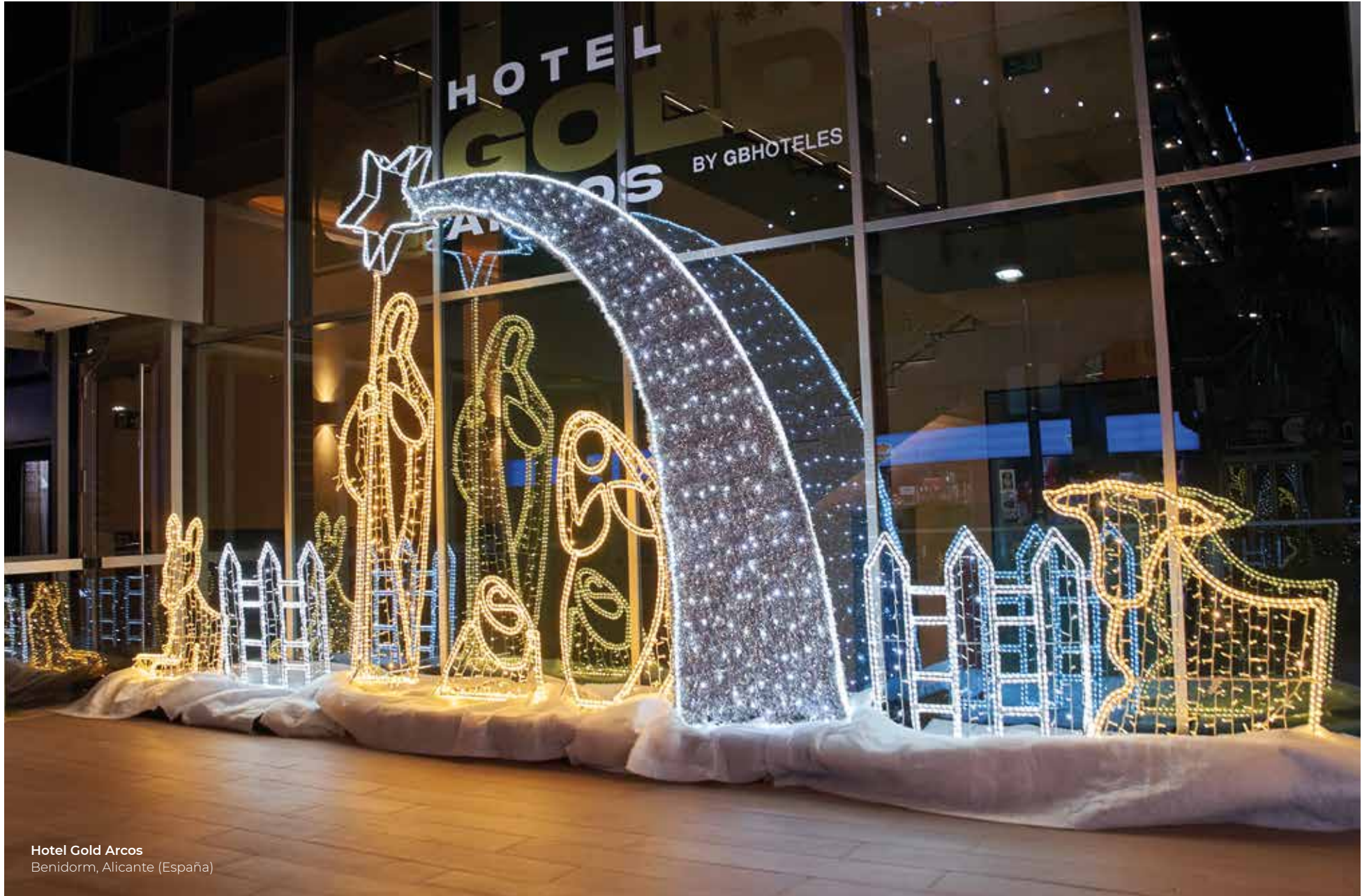
Hotel Gold Arcos Benidorm, Alicante (España)