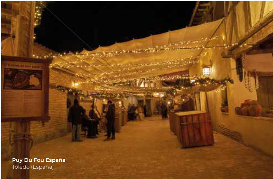
Puy Du Fou España Toledo (España)