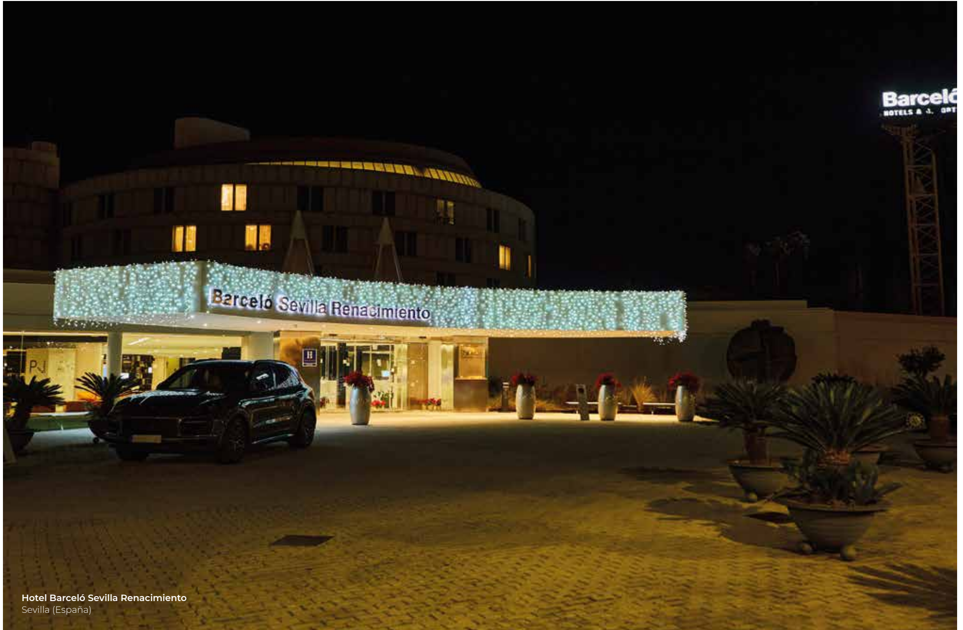
Hotel Barceló Sevilla Renacimiento Sevilla (España)