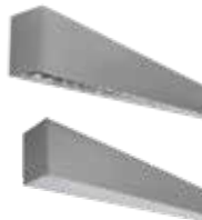
Lynx Led Superficie *