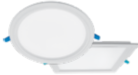
Kentau CL / Kentau SQ *