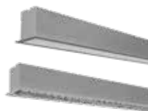
Lynx Led Line Empotrar *