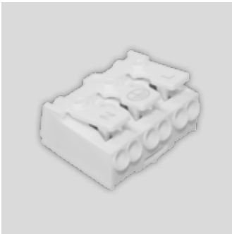
Clema de conexionado rápido (incluido) Quick kit connection (included) Connexion rapide (inclus) Ligador rápido (incluido)