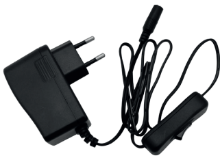
Driver Lineal Touch